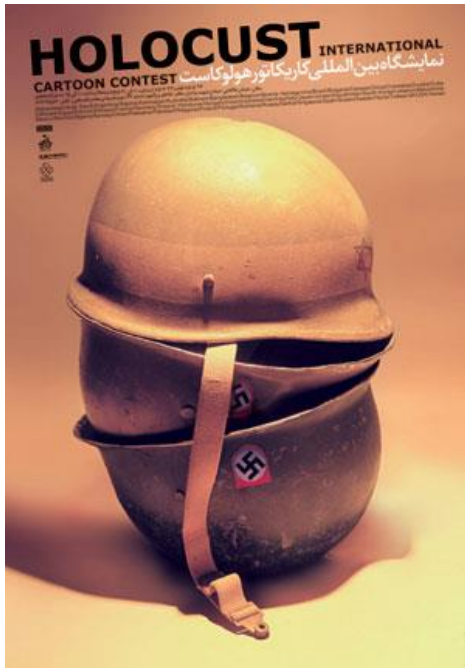
Cartel de la Exposición en el que sobre dos cascos con una esvástica nazi reposa un tercer casco con una estrella de David.

This article focuses solely on the controversy surrounding cartoons depicting the Prophet Muhammad and the exhibition about the Holocaust and the State of Israel. It highlights the difference between fundamentalism and poor taste, including censorship in democratic countries. From a theological perspective, fundamentalist positions presuppose the belief that an individual interprets God's will.