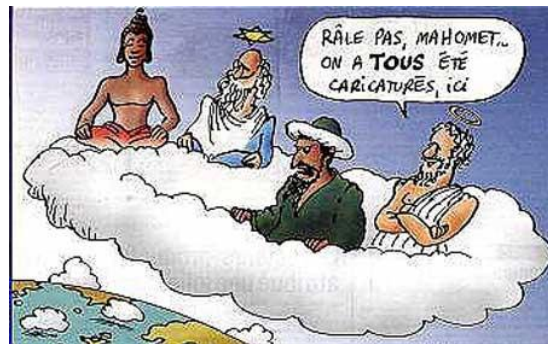
Mahoma, Yave, Jehová y Buda, todos caricaturizados

Locke, uno de los primeros estudiosos de la cultura (formalmente definida o concebida de facto) 3 , así como todos sus contemporáneos que le siguieron en estos temas, a pesar de que atribuían a la experiencia el poder de modelar las creencias y costumbres, así como negaban la existencia de ideas innatas, también admitían la existencia de creencias morales