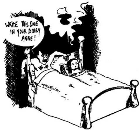
Viñeta de claro contenido anti semita

Frente a la defensa de la libertad de expresión realizada por estos medios europeos el periódico iraní Hamshahri convocó un concurso sobre el holocausto nazi y la subsiguiente creación del Estado de Israel, al que se han presentado más de 1.000 obras de 61 países 1 que ha concluido con la exposición de 200 de ellas en: Holocaust: Holocaust